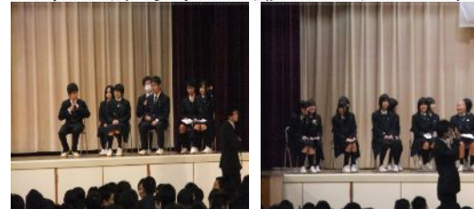
生徒会役員立候補者と推薦者

来年度の生徒会役員を決めるための立会演説会が体育館にて、その後各教室にて選挙が行われました。今回は会長立候補者が2名・書記立候補者が3名おり、投票という形になりました。立会演説会では、立候補者が生徒会への思いや今後の方針などを力強く主張しました。全校生徒はその演説を真剣に聞いており、とても有意義な時間となりました。